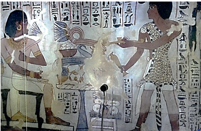
Abbildung der Abydos-Reise Abydos = mythischer Bestattungsort des Totengottes Osiris, einer der wichtigsten Kultplätze des Landes

Die Bootsfahrt zeigt oben einen Priester vor Sennefer und Merit; unten segelt eine Mannschaft.